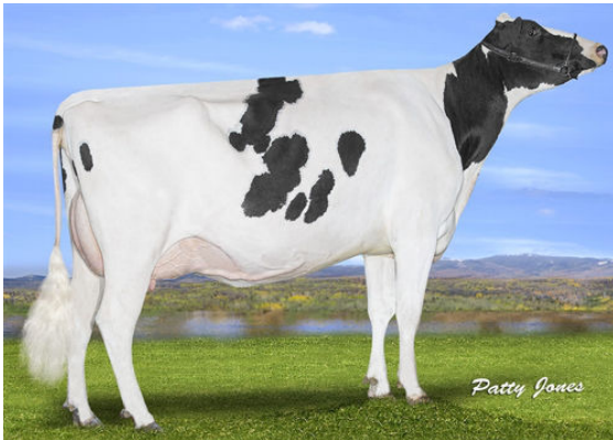
PROGENESIS BAYONET THRUST GRANDDAM