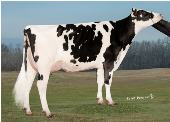
CO-OP BLUMEN DAY 4292 FOURTH DAM